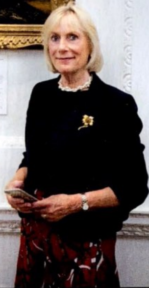
HRH Princess Olga Romanoff